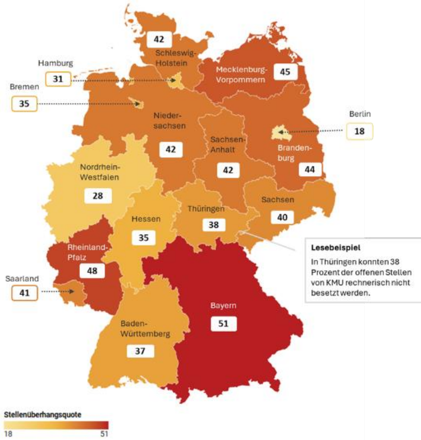
Abbildung 1 | Stellenüberhangsquote für KMU nach Bundesländern (in Prozent) Jahresdurchschnitt zwischen Juli 2024 und Juni 2025, ohne Helfertätigkeiten