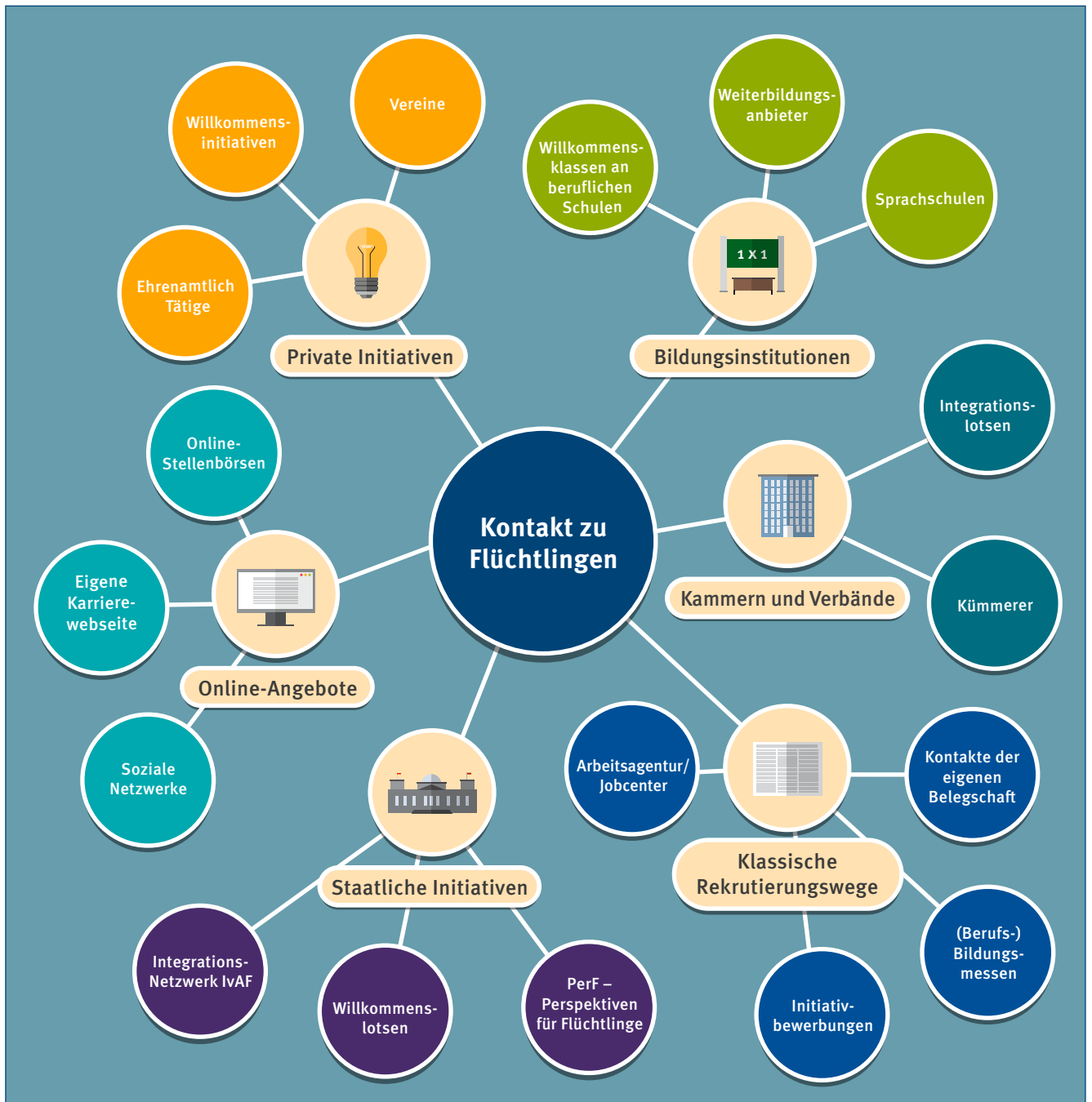
Abbildung 2: Kontaktwege für Unternehmen zu Flüchtlingen

Zudem bringen viele Flüchtlinge eine hohe Motivation und Leistungsbereitschaft mit. Ein großer Teil der Geflüchteten kommt mit dem Wunsch nach Deutschland, hier auf eigenen Füßen stehen zu können und beruflich voranzukommen. Durch ihre Fluchterfahrung haben sie häufig große Hürden und Herausforderungen auf sich genommen und ein hohes Maß an Durchhaltevermögen sowie Selbstorganisation unter Beweis gestellt. Diese Erfahrungen können ihnen dabei helfen, neue Herausforderungen wie den Erwerb der deutschen Sprache oder eine längere Einarbeitungszeit zu meistern. Von diesen Eigenschaften kann auch Ihr Unternehmen profitieren.