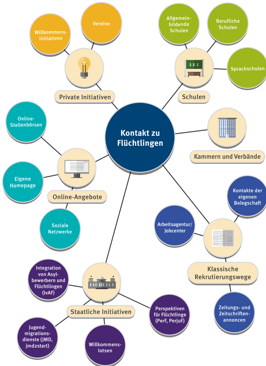
Abbildung 2: Kontaktwege für Unternehmen zu Flüchtlingen

Die vorliegende Übersicht verdeutlicht, welche vielfältigen Wege Ihnen zur Kontaktaufnahme von Geflüchteten zur Verfügung stehen. Welcher Weg oder welche Kombination von Instrumenten für Ihr Unternehmen am besten passt, hängt auch davon ab, welche Vorgehensweise Sie ansonsten wählen.